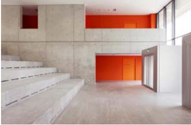
Foyer Kopfbau Süd