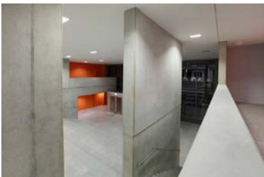
Foyer Kopfbau Süd