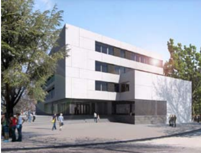
Haupteingang, Blick von der Via Armando Diaz (Neubau) Visualisierung: Karl + Probst