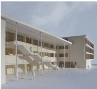
Modellfoto Ansicht Nord-Ost, Wettbewerbsentwurf (Umbau und Erweiterung)